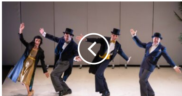
Teatro delle Arti: ven 22 nov Alberto Sordi, ovvero l'italiano medio nel nuovo spettacolo della compagnia Frosini-Timpano

GazzettaToscana.it è un quotidiano online di cronaca indipendente sui fatti che circondano la zona della Toscana.