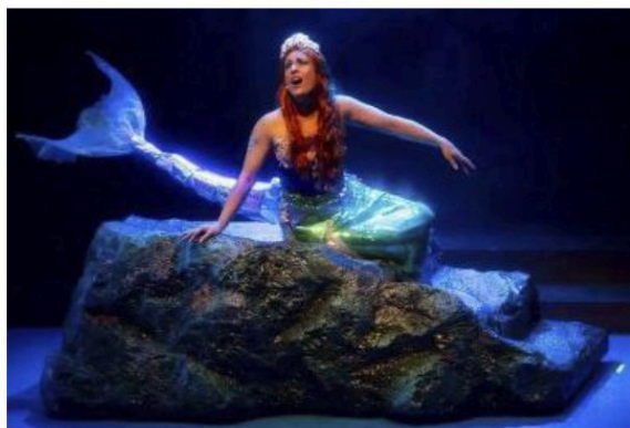
Doppio appuntamento domenica alle 15 e alle 18 con la Sirenetta