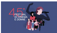
Festival Internazionale Cinema&Donne 20-24 novembre 2024