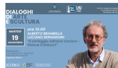
I "DIALOGHI D'ARTE" RACCONTANO CARDUCCI