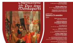
La Pace dopo Montaperti: a Castelfiorentino la rievocazione storica renderà omaggio anche ai volontari impegnati nell'emergenza-alluvione