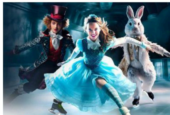
Sabato di scena 'Alice In Wonderland - On Ice', la magia corre sul ghiaccio

Diamo un'occhiata ai prossimi appuntamenti. Sabato 7 dicem-