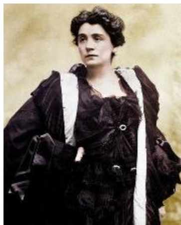
L'attrice Eleonora Duse

«Il Lyceum è il primo club femminile in Italia, attivo e vitale dal 1908 nell'ambiente culturale fiorentino e non solo. Forte di una rete di prestigiosi contatti nazionali e internazionali, ha inteso rendere omaggio a una grande donna, che ha rivoluzionato il modo di fare teatro - dichiara Donatella Lippi, presidente del Lyceum Club Internazionale di Firenze -. Duse ha incarnato le tensioni, le aspirazioni, le sofferenze della generazione di donne che hanno scritto il loro