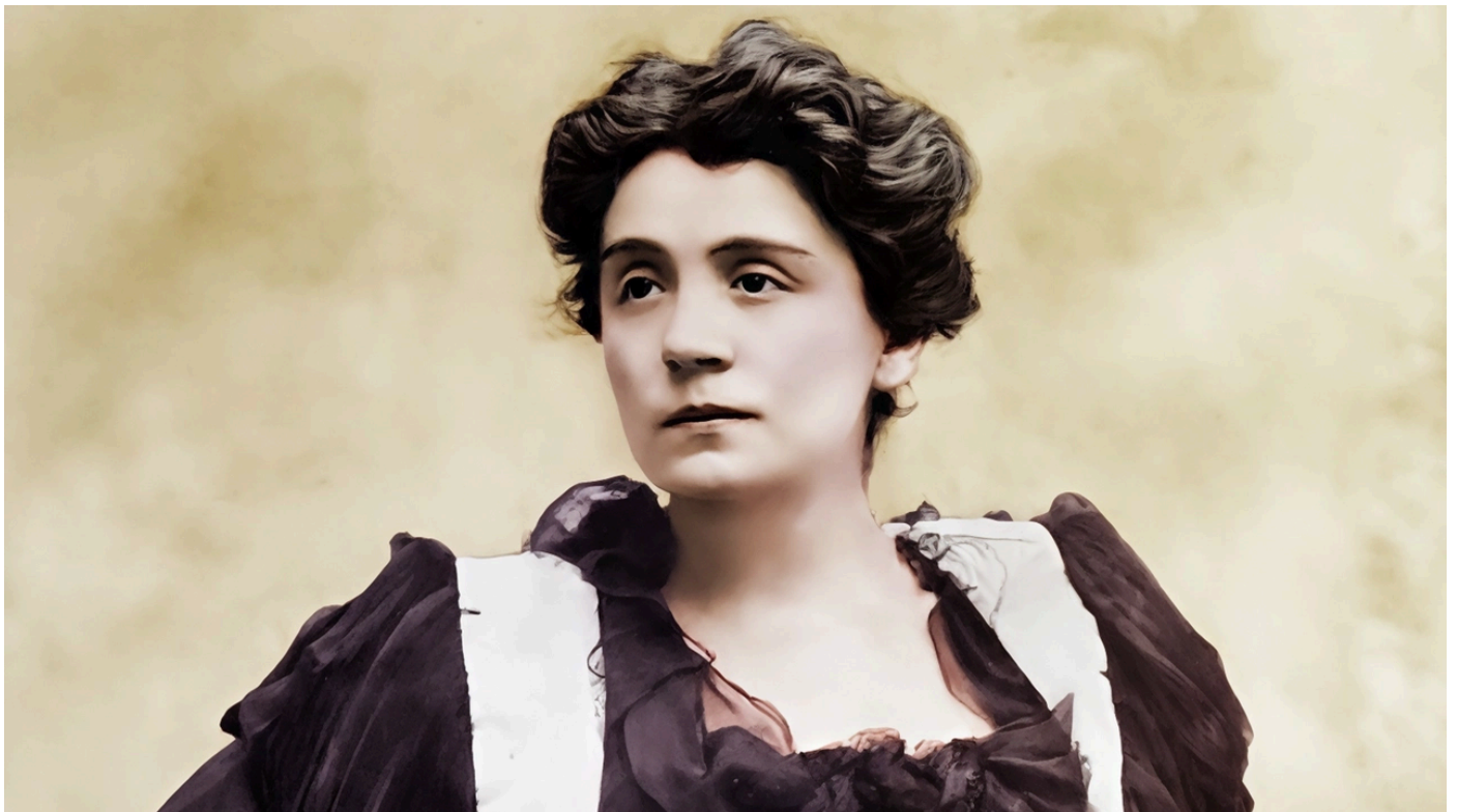
L'attrice Eleonora Duse

Il Lyceum Club Internazionale di Firenze porta in scena "Eleonora Duse. Una vita da Diva" al Teatro della Pergola il 3 ottobre, in onore dell'iconica attrice. Il monologo racconta l'ultima notte della Duse a Pittsburgh, interpretato da Susanna Marcomeni. La manifestazione include visite guidate e premi per giovani attrici.