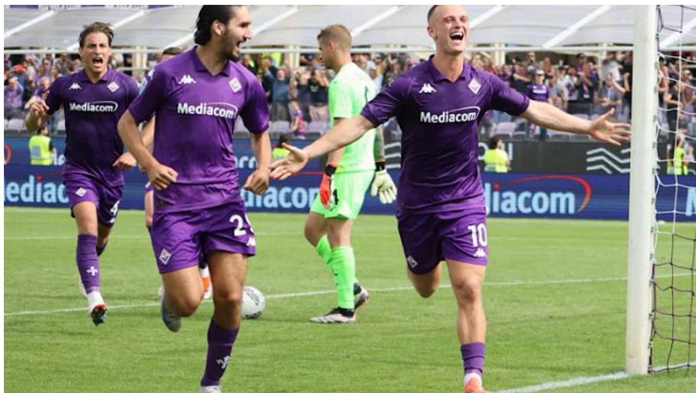
Gudmundsson regala la prima vittoria ai Viola